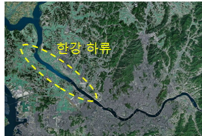
〈그림 5〉 한강 하류의 직류수

하륜이 주장한 무악산 일대는 한강과 가까워 그의 말대로 조운의 편리함을 갖추고 있다. 이곳을 지리신법으로 계측하면 신촌일대를 궁궐로 가정했을 때 무악산은 축방(丑方, 동북방)이며, 한강은 건방(乾方, 북서방)으로 흐른다. 이는 토산(土山)에 문곡파(文曲破)가 되어 역시 지리신법의 이론에 부합되는 것으로 보인다. 그럼에도 불구하고 대다수 조정 대신들의 말처럼 명당이 좁고 용호도 갖추지 못해 일국의 도읍지로 삼기에는 부족함이 많은 땅이다. 특히 외부의 침입으로부터 도성을 방어하기에는 산이 낮고 취약하다는 점은 공감을 얻기 쉽지 않았을 것으로 보인다. 더욱 결정적인 취약점은 한강이 용산을 지나서 마포 인근부터 한강 하류까지 약 23km가 곧고 길게 형성되었다는 점이다. 이는 앞에서 전술한 바와 같이 풍수에서 가장 꺼리는 직류수인 것이다. 실제로 한강이 직수로 흐르는 마포 이후부터 임진강과 합류하는 하류까지는 서울과 가까운 곳이라는 지리적이점이 있지만 삼국시대부터 현재까지 단 한 번도 주목받지 못했다. 22)