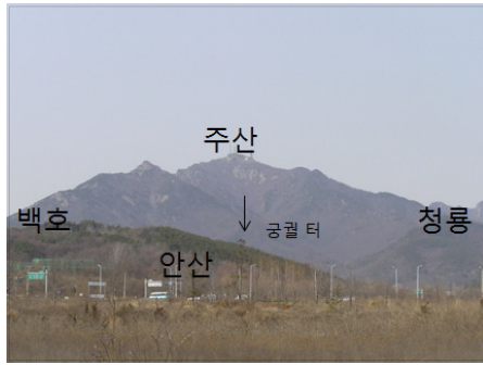
〈그림 6〉 계룡산 천황봉과 신도안, 2009년 3월 21일

신도안 내외에서 점검하면 전혀 다른 국세를 이루고 있다. 즉 신도안 중심지는 용호가 교쇄를 해주어 적당한 크기의 국세를 이루고 있으며, 외부에서 보면 신도안 중심지가 전혀 노출되지 않는다. 좌측 사진에서 보듯이 신도안의 백호가 길게 감싸주었기 때문이다. 따라서 하륜이 우려한 것처럼 신도안의 물길