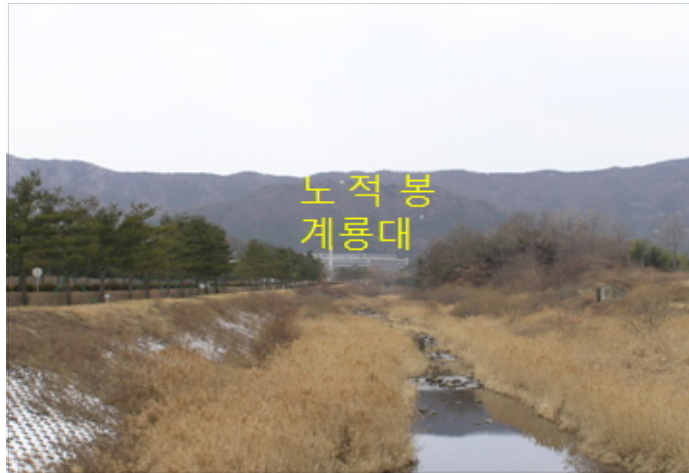
〈그림 11〉 계룡대와 물길, 2006년 1월 20일 필자촬영

신도안의 현재 모습은 1983년 전두환 대통령시절에 국토의 균형발전과 군사적 목적으로 3군사령부 이전이 추진되면서부터 이루어졌다. 3군사령부건물은 조선왕조가 계획했던 천황봉을 주산으로 삼는 동남향의 입지와는 다르게 노적봉을 주산으로 삼아 동향으로 배치하였다. 하지만 노적봉을 주산으로 삼다보니 사령부 건물 좌우에서 합수된 물이 정면으로 약 1km정도 곧게 빠지는 형태가 되었다. 내명당의 물은 내치를 관장하는 매우 중요한 사항인데, 한 나라의 국방을 책임지는 사령부건물로서는 치명적 결함이 아닐 수 없다.