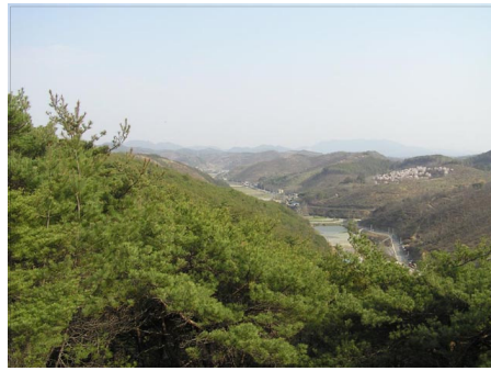
〈그림 3〉 하륜 선영의 물길, 2009년 3월 21일

앞쪽의 안산에 깊은 골이 많아 찢겨진 모습이니, 그 형태가 바람직한 모습이 아니다. 참고로 안산은 혈처를 향해 깨끗하게 면을 펼쳐 유정함을 보여야 좋다. 17) 네 번째는 묘 앞으로 흐르는 오방천 물길이다. 풍수에서 물길은 들어오는 물 득수는 길고, 나가는 물 파구는 짧아야 함을 원칙으로 여긴다. 즉 물은 재물과 경제력을 의미하기 때문에 공급은 안정적이고 수요는 절제됨을 요하는 것이다. 그러나 이곳 오방천의 물길은 득수는 짧고 파구는 길게 늘어지고 있어 불리한 형태를 이루고 있다. 나가는 물은 가급적 크게 굽이치며 흘러야 길한 것이다. 18)