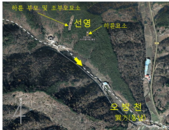
〈그림 4〉 하륜 선영의 지형도, 필자작성