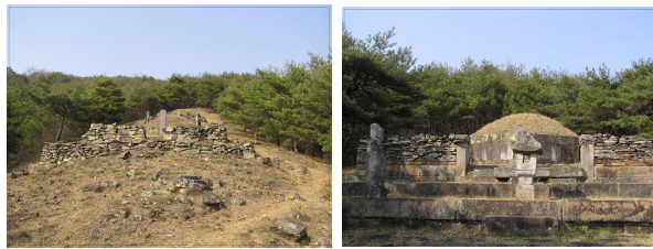
〈그림 1〉 하륜의 조·부모 묘소 〈그림 2〉 하륜 묘소

여기서 주목할 것은 '신이 일찍이 신의 아버지를 장사하면서 풍수 관계의 여러 서적을 대강 열람했다'는 내용이다. 즉 상소를 올리기 전에 그의 부친 묘를 선정한 것인데, 부친 진양부원군 하윤린(河允潾)의 사망은 상소를 올리기 직전으로 보인다. 13) 따라서 하윤린의 묘를 보면 어느 정도 하륜의 풍수관을 짐작할 수 있을 것으로 보인다.