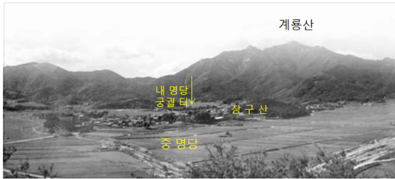
〈그림 7〉 신도안의 옛 모습 28)