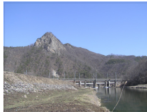
〈그림9〉 두계천 물길2 2014년 10월 12일 필자작성