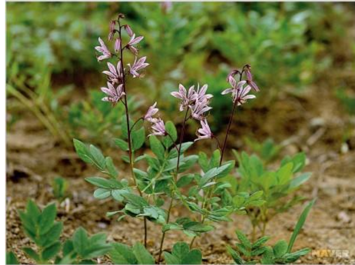
백선 꽃